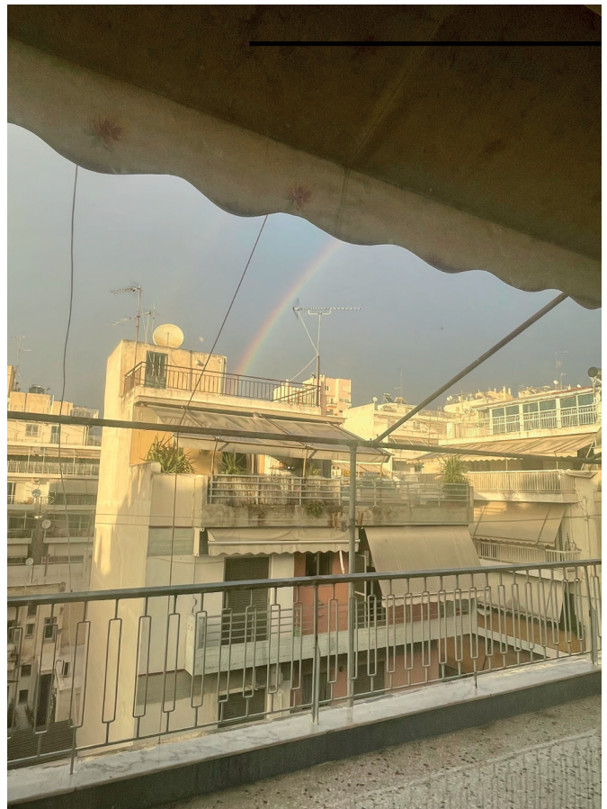
Ausblick aus der letzten Wohnung

Gegen Ende unseres Semesters im Januar wurden die meisten griechischen Unis aufgrund von Besetzungen und Protesten, zunächst durch Studierende, später auch von Professor*innen, geschlossen. Somit sind die Veranstaltungen ausgefallen und über Wochen wurden Prüfungen verschoben und am Ende überwiegend in Hausarbeiten umgewandelt.