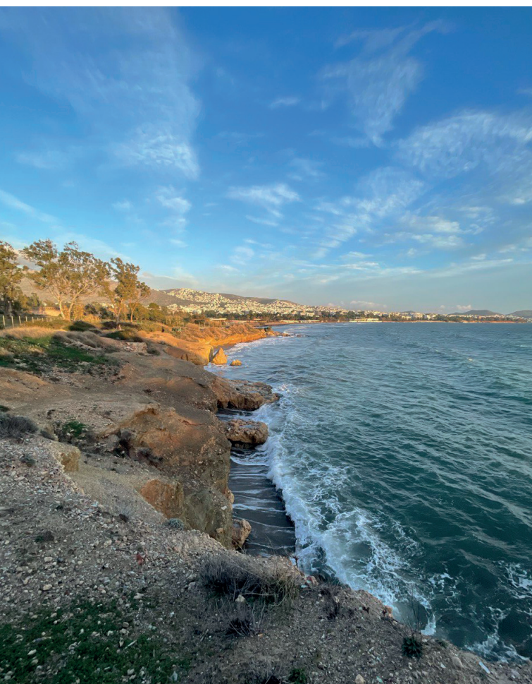
Strand bei „Voula Beach“

Außer mir studierten noch 3 andere Kommiliton*innen aus Merseburg und wir haben uns einige Tage vor Unibeginn schon getroffen. Mir gab das ein gutes Gefühl und ich bin dadurch etwas selbstbewusster in die Einführungsveranstaltung gestartet. Natürlich war für mich die Situation aber auch etwas anders, weil ich mit meinem Partner in Athen lebte, und einen großen Teil meiner Freizeit daher mit einer zweiten Person verbrachte.