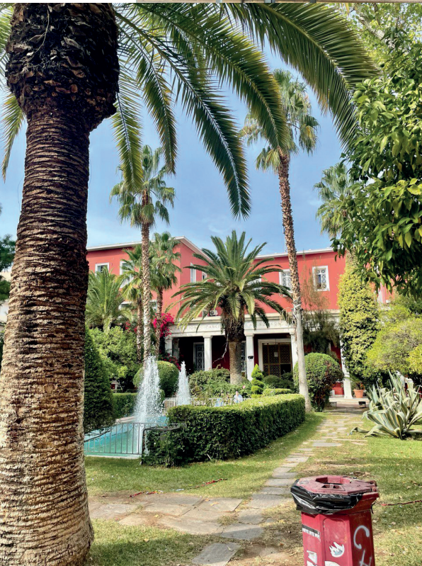
Eingang der Panteion Universität