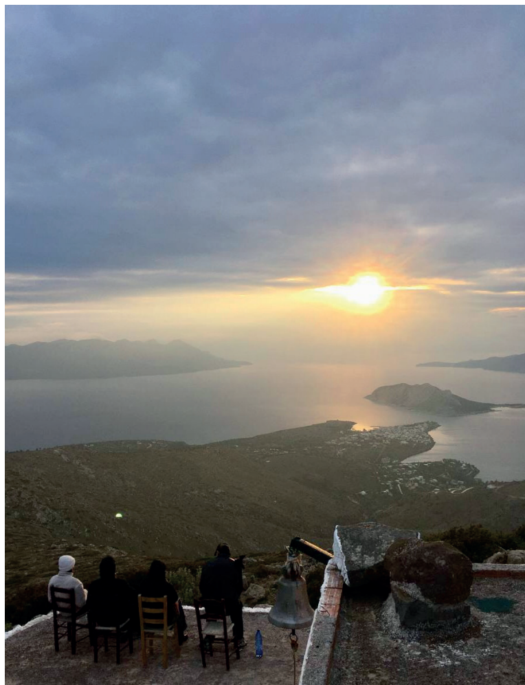
Ausblick vom Mount Ellanio auf Aegina