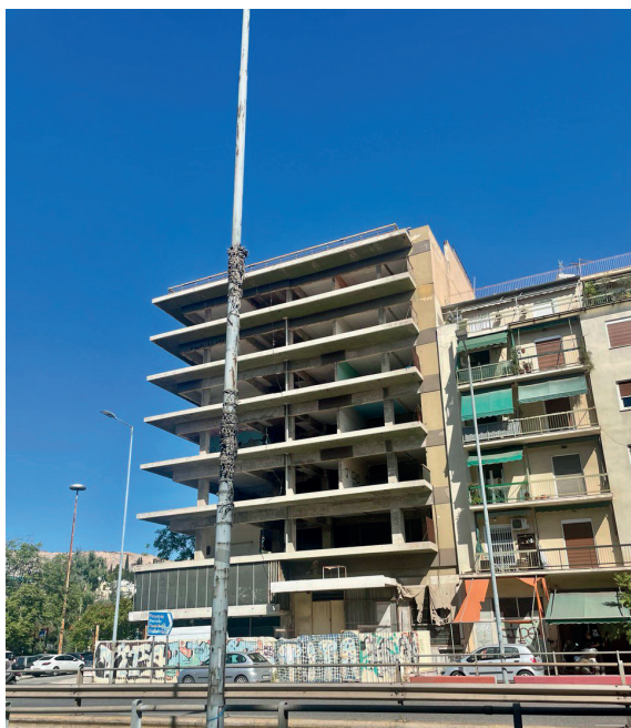
Robbau mit Mensa im EG

Ich war nachts wenig allein unterwegs und kann nur für meine persönliche Erfahrung sprechen: ich habe mich kaum unwohl gefühlt bzw. mich immer getraut, rauszugehen. Die westliche Ecke um Omonia herum habe ich dabei aktiv gemieden. Über andere Viertel kann ich nicht so viel sagen und ich sehe daher davon ab, hier bestimmte Gegenden zum Wohnen zu empfehlen - scusi.